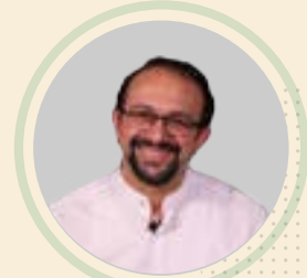
علی ترقی جاه